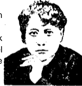
HELENA PETROVNA BLAVATSKY PROFETES VAN DIE MODERNE TEOSOFIE

Reïnkarnasie stel jou in staat om 'n proses van rypwording te bereik — dit louter jou, dit lei jou op jou pelgrimstog na jou Hoë Self, dit stel jou in staat om 'n vrye, geestelike, goddelike persoonlikheid te ontwikkel.